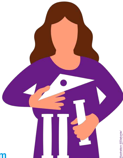
Illustration: ©Diakonie/ Francesco Ciccolella