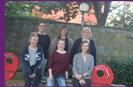
Das Team des Fachbereichs der Schwangerenberatung inkl. Babylotsin

Leider gibt es immer noch viele Menschen, die das volle Spektrum unserer Beratungsstellenarbeit nicht kennen. Dabei bieten wir Unterstützung bei der Beantragung finanzieller Hilfen, beantworten Fragen rund um die Schwangerschaft und Geburt und darüber hinaus, bis das Kind drei Jahre ist.